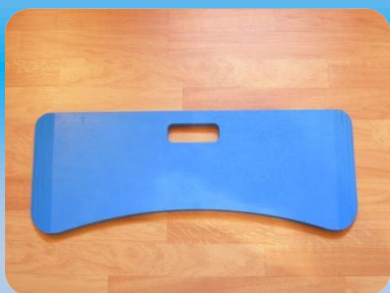
Planche de transfert courbe