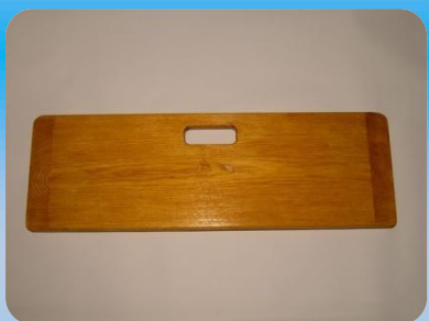
Planche de transfert droite