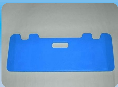
Planche de transfert Avec encoches